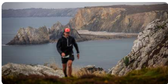
Grand Raid du Finistère 2025