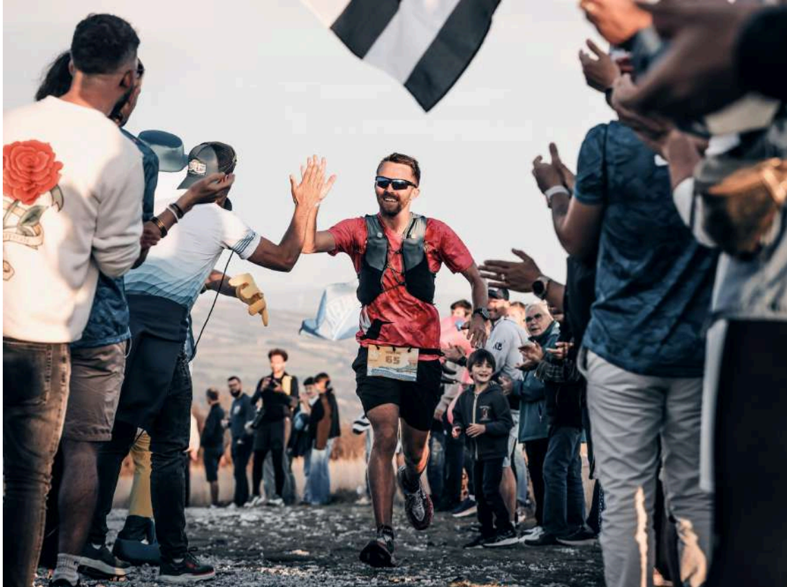
Grand Raid du Finistère 2025

Les coureurs de toutes les courses avaient les yeux plongés dans l'océan sur la ligne du départ face à la grande plage de Telgruc-sur-Mer. Dans leurs esprits se dessinaient déjà les moments forts qui allaient rythmer leur chemin. Le Menez Hom (330m), le plus haut sommet du parcours à atteindre au coucher du soleil. Sans doute n'avaient-ils pas imaginé l' ambiance incroyable de tous les accompagnateurs et les bénévoles qui avaient poussé la grimpette jusqu'au sommet ! Puis la descente vers Landévennec dans la forêt. A l'attaque de la nuit, le long de la rade, les lumières de Brest au loin qui scintillent comme un phare, rassurant. Cette nuit a été calme, douce. Et alors que les premiers étaient en vue de Camaret et de ses plages, devinées à la lueur des frontales, la plupart des concurrents ont dû y affronter le climat breton quelques heures plus tard, au matin ! Car à cet endroit, rien n'arrête le vent. L'océan et les embruns n'ont plus remparts que le torse des coureurs.